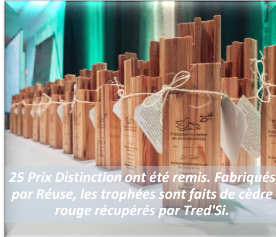
25 Prix Distinction ont été remis. Fabriqués par Réuse, les trophées sont faits de cèdre rouge récupérés par Tred'Si.