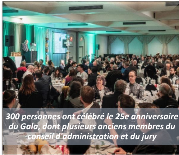
300 personnes ont célébré le 25e anniversaire du Gala, dont plusieurs anciens membres du conseil d'administration et du jury