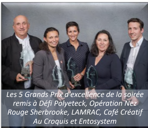
Les 5 Grands Prix d'excellence de la soirée remis à Défi Polyetec, Opération Nez Rouge Sherbrooke, LAMRAC, Café Créatif Au Croquis et Entosystem